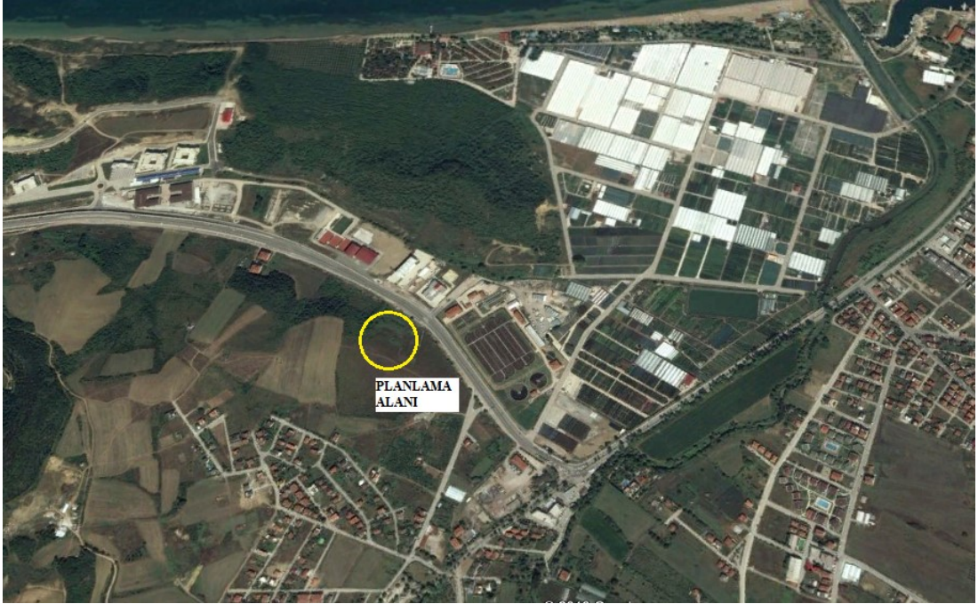
Planlama alanı

Parsellerin kuzeyinden 60 m enkesitli Yalova-Armutlu Yolu, güneyinden 10 m imar yolu geçmekte olup parsellere ulaşım bu yollarla sağlanabilmektedir.