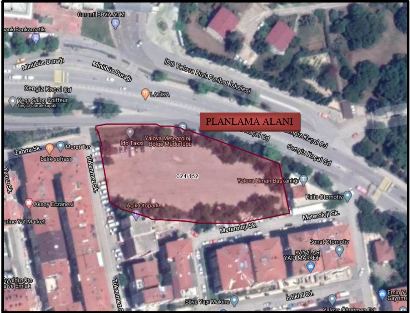
Harita 1: Planlama Alanı ve Yakın Çevresi Uydu Görüntüsü

Planlama alanı olan Yalova ili, Merkez İlçesi, Süleymanbey Mahallesi sınırları içerisinde yer alan 324 ada 152 sayılı parselin bir kısmını kapsamaktadır. Planlama alanının toplam büyüklüğü yaklaşık 1.745,44 m 2 ' dir.