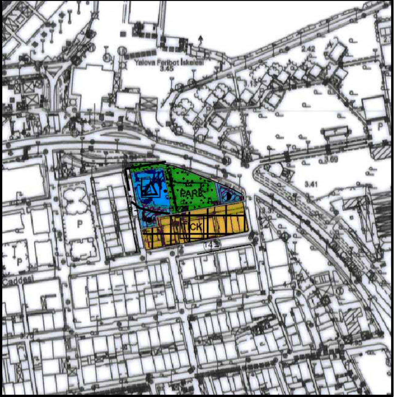
Harita 3:Plan teklifi

Söz konusu alanda nüfus ve yapı yoğunluğunu artırıcı herhangi bir değişiklik yapılmadığından; kentsel teknik altyapı etki değerlendirmesi raporu hazırlanılmamıştır. Analiz ve sentez çalışmaları Uygulama İmar Plan Değişikliği Plan Açıklama Raporunda detaylı bir şekilde verilmiştir.